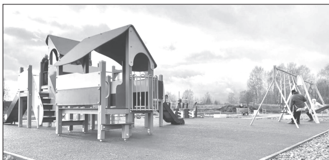
Зон отдыха, колодцев и фонарей на селе станет больше

«В реализации этих проектов большое значение имеет инициатива местных жителей и готовность граждан и бизнеса внести денежный или трудовой вклад в создание объекта благоустройства, необходимого на конкретной территории», - от-