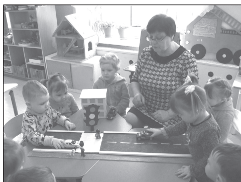
Д/с №8: изучение правил поведения на дороге