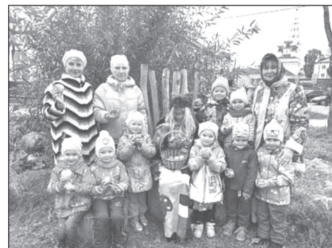
Д/с №3: спасём русские сказки!

Берегите себя и своих близких - пройдите вакцинацию!