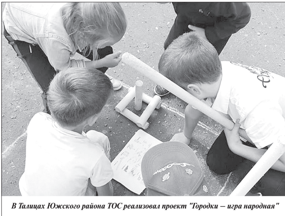
В Талицах Южского района ТОС реализовал проект «Городки — игра народная»