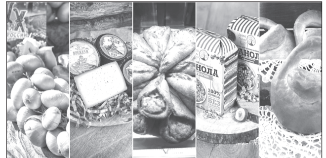
Ивановские продукты получили одобрение от покупателей

Бренд из Пучежского района сыр «Пучеж Премиум» - полутвердый, выдержанный сорт сыра, разрабо-