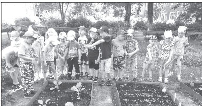
Д/с №5: что такое огород?