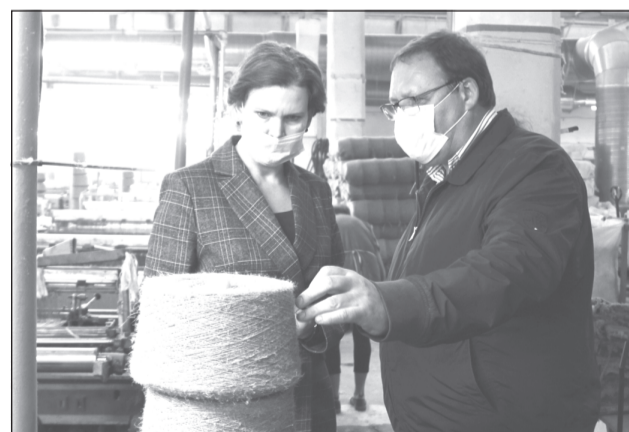
Средства фонда помогут предприятию провести модернизацию производства