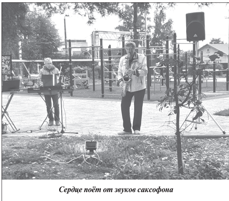
Сердце поёт от звуков саксофона