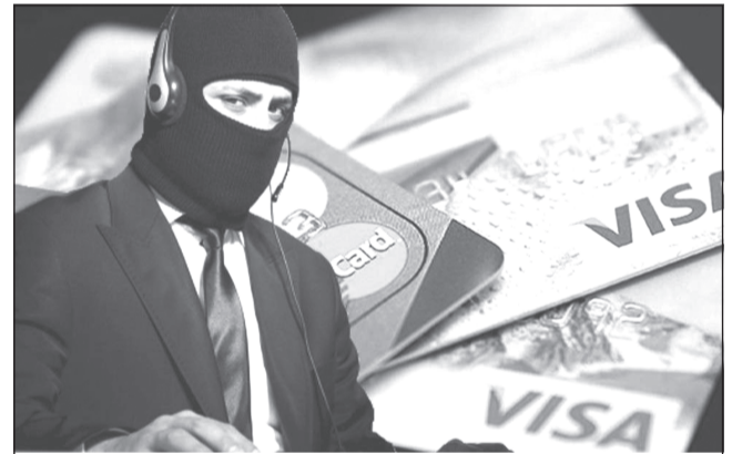
Если вы сомневаетесь в том, что звонит сотрудник банка, положите трубку

Если у мошенников могут быть данные вашей карты,