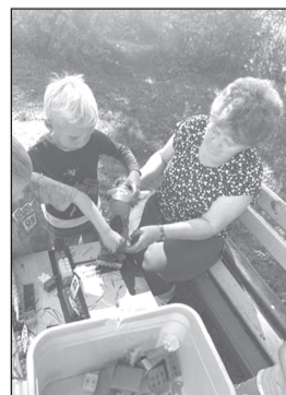
Д/с №6: открыто летнее кафе