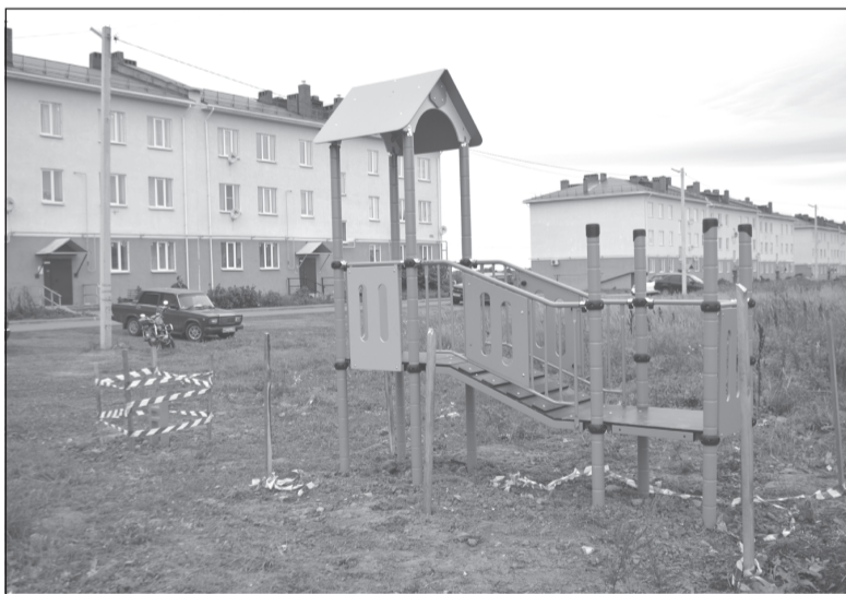
Это только начало

Квартира в новостройке – мечта любого жителя. И, кажется, нет счастливее человека, чем новосел. Однако проходит период привыкания, и нередко начинаются нарекания по поводу отдаленности места жительства от центра города, отсутствия благоустройства, детской или спортивной площадки.