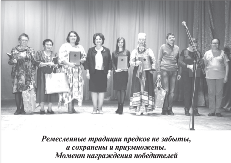
Ремесленные традиции предков не забыты, а сохранены и приумножены. Момент награждения победителей

Торжественная церемония подведения итогов и награждения победителей конкурса «Ремесло – душа моя» прошла в Южском районном Доме культуры. Конкурс направлен на выявление и поддержку талантливых мастеров народных ремесел, сохранение культурного наследия Ивановской области.